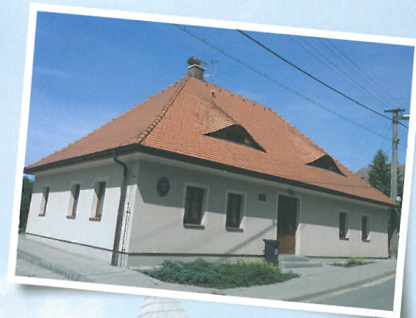
Bývalá fara, po rekonstrukci sídlo Obecního úřadu Vlastibořic.