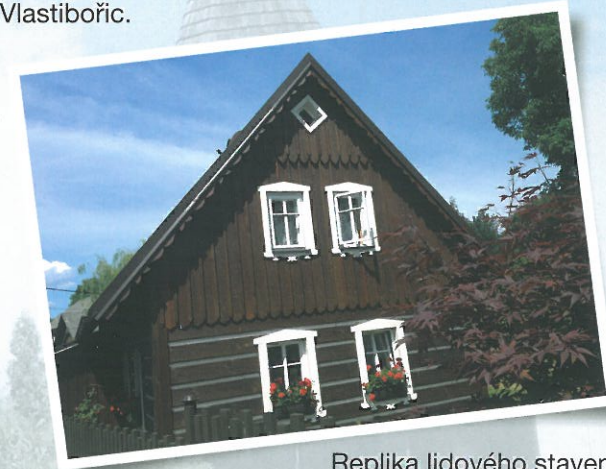
Replika lidového stavení.