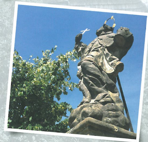
Socha svatého Jana Nepomuckého.