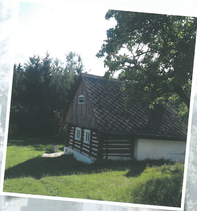
Pozůstatky tvrzíště u č. p. 1 v obci Albrechtice

Keltové přišli na toto území v 1. stol. př. n. l. První stáletí našeho letopočtu, doba římská (0 – 4. stol. n. l.) a období stěhování národů (4. – 5./6. stol. n. l.), zůstávají v našem regionu prozatím nejasné. V 6. století k nám přišli Slované. Ve 13. a 14. století začíná postupně docházet k zakládání (staro)nových vesnic a k opětovnému zahušťování jejich sítě. V některých z nich zakládá místní rodová šlechta svá panská sídla (Albrechtice, Vlastibořice).