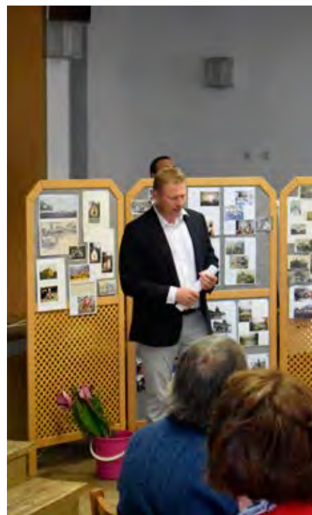
Další fotky ze Setkání naleznete na zadní obálce.