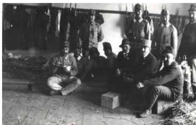
Obrázek 2 – záložníci první výzvy v jedné ze školních tříd