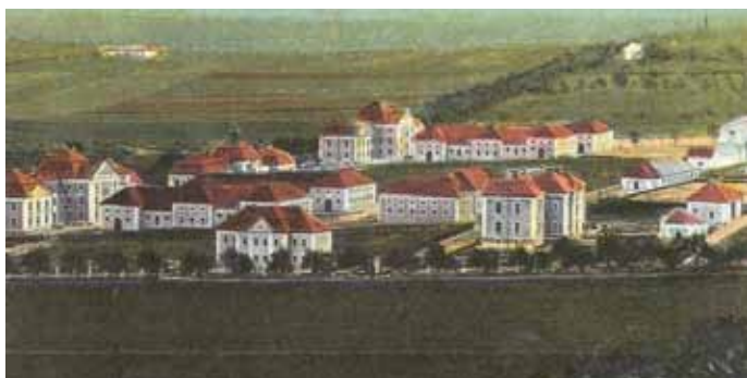
Obrázek 13 – kasárna Milana Rastislava Štefánika, Most