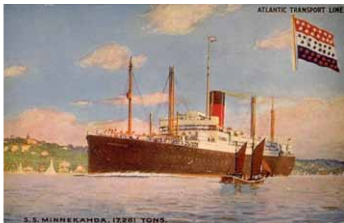
Obrázek 15 – dopravní parník Minnehalda