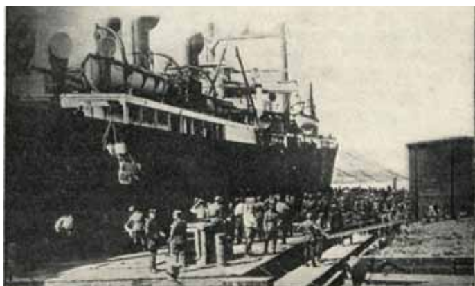
Obrázek 12 – naložování na loď „Protesilaus“