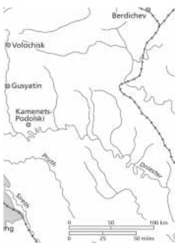
Obrázek 5 – Brusilova ofenziva v létě 1916

bylo zajatce kontaktovat a informovat je o vzniku československé armády a o podmínkách, za nichž do ní mohou vstoupit. Snažili se také zlepšovat životní podmínky zajatců. Ti, kteří se chtěli přihlásit, zaslali žádost výkonnému výboru svazu, který je ověřoval a předal do rukou ruských úřadů ke konečnému schválení. Opravdový nábor začal až po únorové revoluci