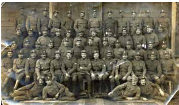
Obrázek 8–9. pluk Karla Havlíčka Borovského, zákopnický oddíl