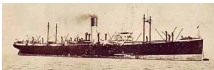
Obrázek 14 – Anglická loď Proteusilaus