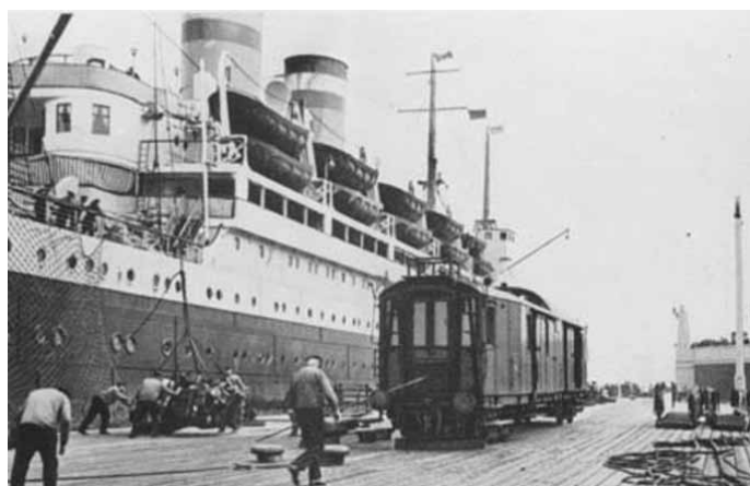
Obrázek 16 – německý přístav Cuxhafen