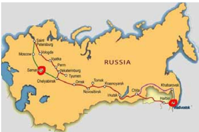
Obrázek 9 – Sibiřská magistrála