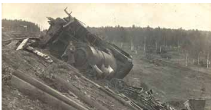
Obrázek 11 – lokomotiva vykolejená oddíly rudých