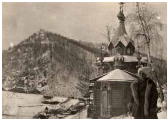
Obrázek 10 – Bajkal, stanice Marituj