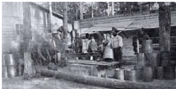
Obrázek 4 – kuchyň zajateckého tábora v Dárnici

července 1916 prorazili Rusové na naší straně frontu, na nás však neútočili a tak bylo nebezpečí, že nás obklíčí. Jednoho dne byl dříve oběd a pak přišel rozkaz nepozorovaně ustupit. V zákopech zůstalo jen několik polních četníků, kteří stříleli, aby oklamali nepřítele. Ustupovali jsme přes Pinská blata, samý močál, ale pořádná voda nikde. Sotva jsem se táhl, ale šlo se dále. Při jednom krátkém odpočinku jsme si převarili trochu vody a plnili ji do lahví. Když jsem měl svoji láhev tak do poloviny naplněnou, strhla se najednou střelba, kulky jen hvízdaley. Vyběhl jsem na kopeček jako jelen a už nám to začali sypat ze všech stran. Našel jsem velký pařez a zalehl jsem. Ale ono to lítalo z obou stran, přehazoval jsem zadek sem a tam. Konečně nastala tmavá noc a střelba utichla. My jsme zatím utíkali nocí, bažinami, ve kterých byla cesta z dřevěných poválek, za stálé střelby. Běda tomu, kdo skočil z poválek, chtěje se