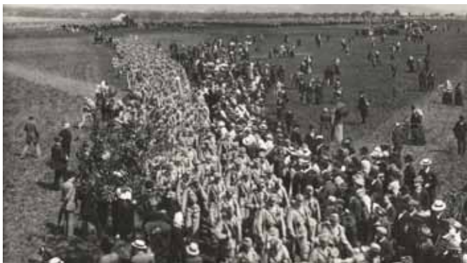
Obrázek 3 – po slavnostní přísaze odchází domobrancí na turnovské nádraží

července 1916 prorazili Rusové na naší straně frontu, na nás však neútočili a tak bylo nebezpečí, že nás obklíčí. Jednoho dne byl dříve oběd a pak přišel rozkaz nepozorovaně ustupit. V zákopech zůstalo jen několik polních četníků, kteří stříleli, aby oklamali nepřítele. Ustupovali jsme přes Pinská blata, samý močál, ale pořádná voda nikde. Sotva jsem se táhl, ale šlo se dále. Při jednom krátkém odpočinku jsme si převarili trochu vody a plnili ji do lahví. Když jsem měl svoji láhev tak do poloviny naplněnou, strhla se najednou střelba, kulky jen hvízdaley. Vyběhl jsem na kopeček jako jelen a už nám to začali sypat ze všech stran. Našel jsem velký pařez a zalehl jsem. Ale ono to lítalo z obou stran, přehazoval jsem zadek sem a tam. Konečně nastala tmavá noc a střelba utichla. My jsme zatím utíkali nocí, bažinami, ve kterých byla cesta z dřevěných poválek, za stálé střelby. Běda tomu, kdo skočil z poválek, chtěje se